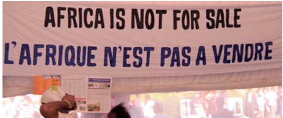
Foto: Lliga dels Drets dels Pobles. Forum Social Mundial de Nairobi, Gener 2007