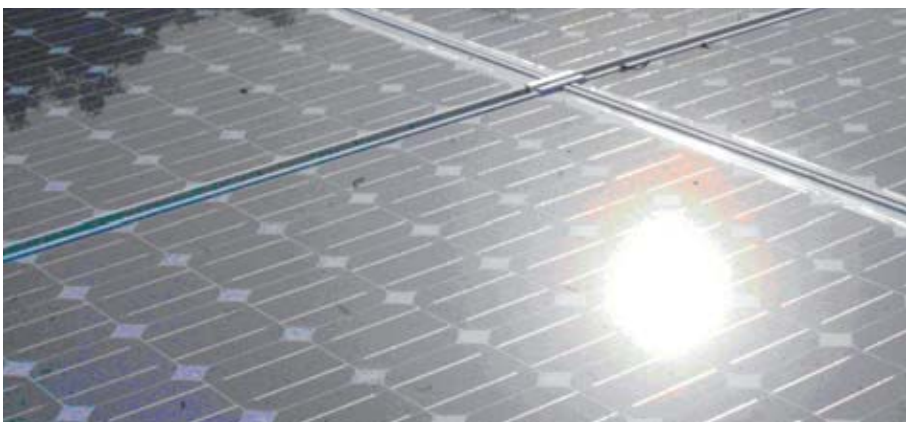
Projecte de sostenibilitat mediambiental de l'Hospital Catalunya de la Fundació Akwaba a Costa d'Ivori.

Potser al nord, es comencen a plantejar nous models de vida, que segurament allargarà la vida d'aquests recursos naturals, però avui dia, aquests mètodes alternatius o aquesta reducció del consumisme ja no hauria de plantejar-se com una opció sinó com una única sortida per a donar vida a les futures generacions.