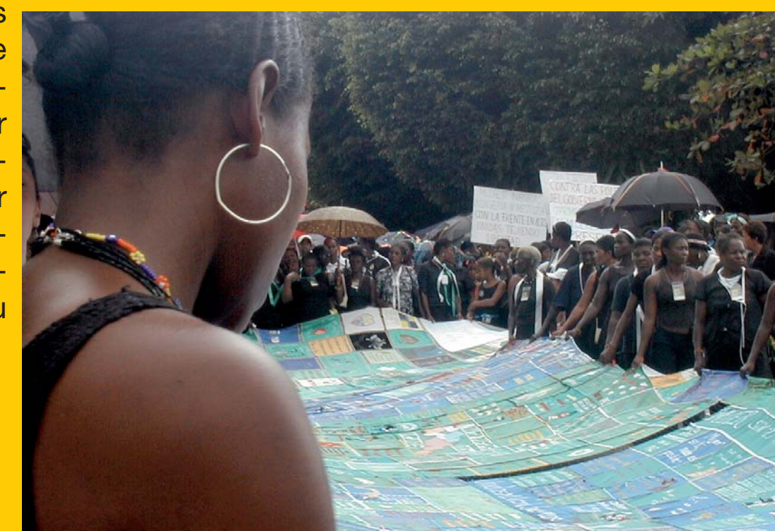
Fotograma del Documental Tejedoras de Paz

Documental produït per: Amnistia Internacional Holanda, PuntoDoc, Making Docs.