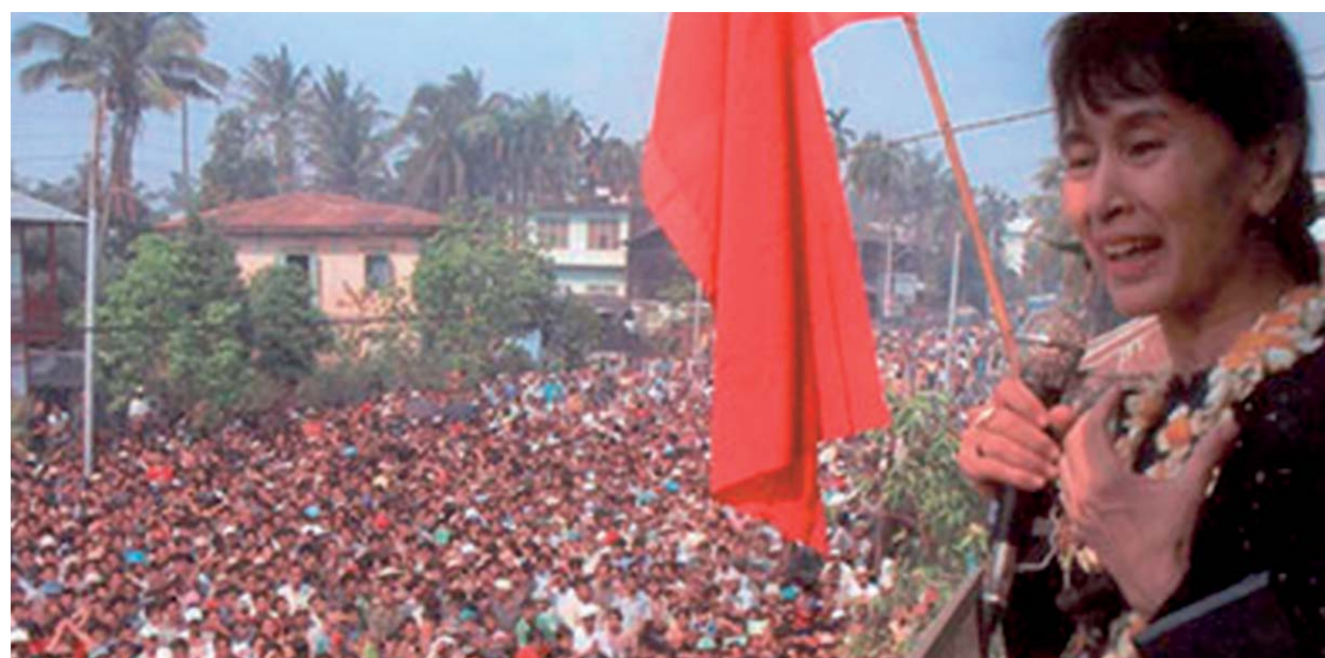
La líder de la oposició birmana, Aung San Suu Kyi