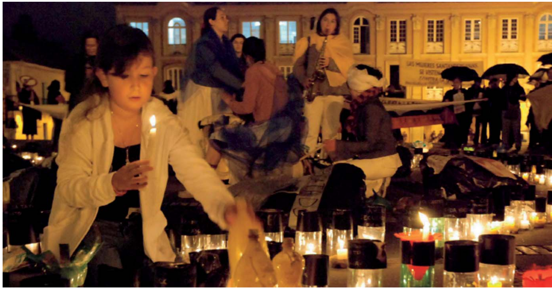
Concentració Ruta Pacífica de Mujeres a Colòmbia. Cooperacció.

Ja han passat 12 anys d'aquella primera mobilització que van fer realitat diferents organitzacions de dones colombianes quan es van desplaçar per mar i terra fins a Urabá, per donar suport a les dones que patien en silenci les conseqüències de la guerra. La Ruta Pacífica de Mujeres de Colombia és un moviment format per 350 organitzacions femenines, que es mobilitzen per demanar una resolució pacífica del conflicte que viu el seu país, en el qual les víctimes són principalment les dones. Sorgeix en un context de violència generalitzada al país, com una proposta feminista que encara la crua realitat del conflicte armat colombià i el seu impacte en la vida de les dones. Índies, negres, velles, joves, feministes o obreres, totes s'uneixen sota un únic objectiu; teixir un moviment que contribueixi a la pau de totes. Des d'aleshores no han parat, i any rere any es desplacen en ruta fins a algun punt del país que estigui en crisi, per donar suport a les seves companyes i fer visible a nivell internacional la