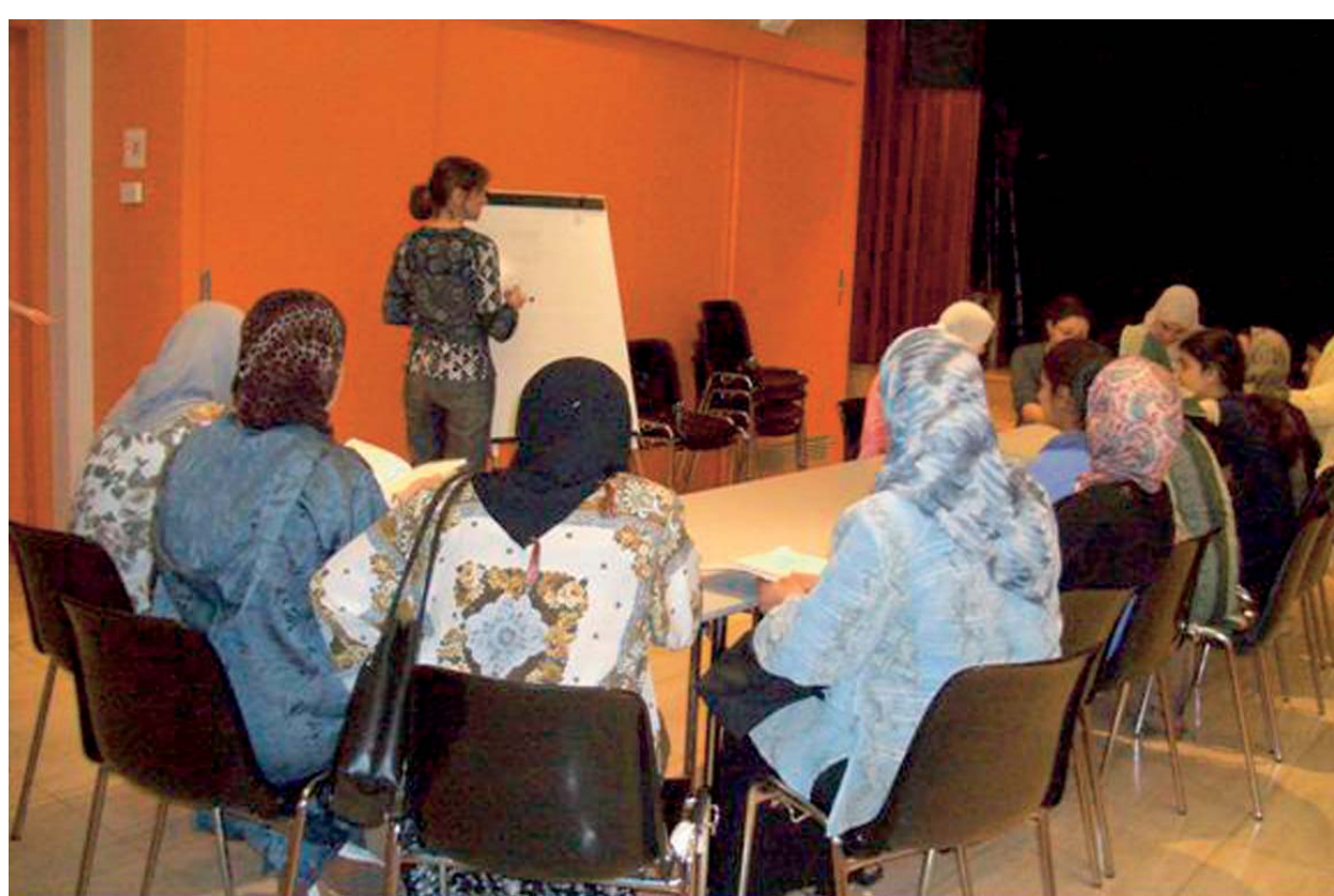
Taller d'inserció laboral d'Akwaba.

Quan hom parla de gènere i de dona, pensa en un perfil de dona determinada i diuen: avui dia a casa