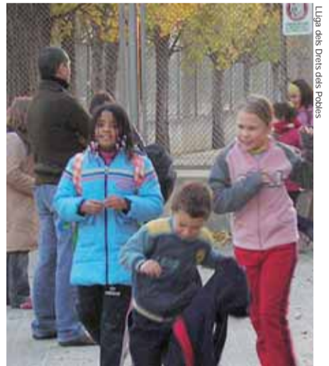
Sortida de l'escola a Sabadell.

Carme Ferrer Observatori de la Immigració de Sabadell Lliga dels Drets dels Pobles