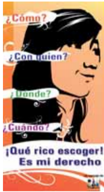
Campanya de sensibilització de La Corriente

Algunos desafíos que debemos continuar trabajando: